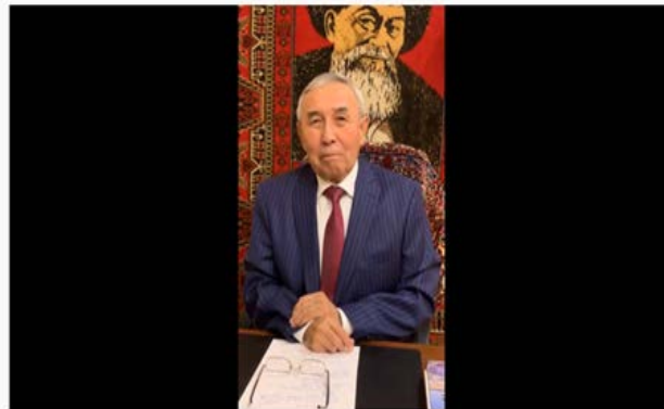
Нағашыбек Қапалбекұлының «Дара тұлға» атты онлайн-дәрісі

2.2.9. Онлайн лекция Капалбекова Н. – главного научного сотрудника на тему «Дара тұлға» Ко Дню Первого Президента Республики Казахстан. 30 ноября 2020 г.